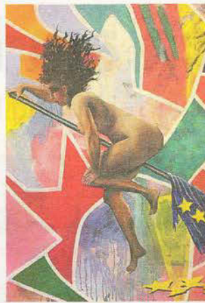
Quo vadis, Europa? Das ist eine der Leitfragen dieser Ausstellung.

ERDING · Die diesjährige Jahresausstellung des Kunstvereins Erding hat das Thema »Europa«. Wieder waren Künstler aus ganz Bayern eingeladen, Arbeiten dazu einzureichen. Aus knapp 150 Einreichungen hat die gewählte Jury 37, zum Teil mehrteilige Werke von 29 Künstlern für die Ausstellung ausgewählt, die am Freitag, 2. August, 19 Uhr, im Frauenkirchler Erding eröffnet wird. Es werden zwei Preise verliehen, der Kunstpreis des Kunstvereins Erding, von der Kreis- und Stadtparkasse Erding-Dorfen gesponsert und der Kunstpreis des Landkreises Erding. Zur Ausstellung erscheint wie jedes Jahr ein hochwertiger Katalog. Die Ausstellung ist bei freiem Ein-